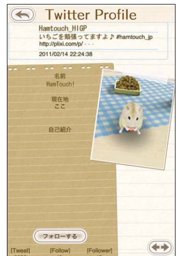
投稿者にアプリから直接フォローできる

HIGP は今後も、ペットを通じてユーザー間がコミュニケーションを楽しめるコンテンツ展開を進めるとともに、ユーザーの皆さまにとって楽しく魅力あるゲームコンテンツ制作に注力してまいります。