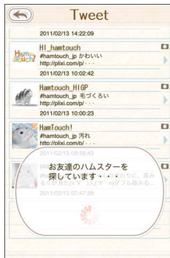
過去の情報を閲覧できる