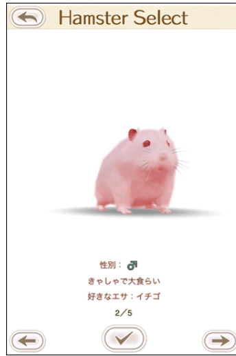
最初のセレクト時やプロフィールでハムスターの特徴を知ることができる